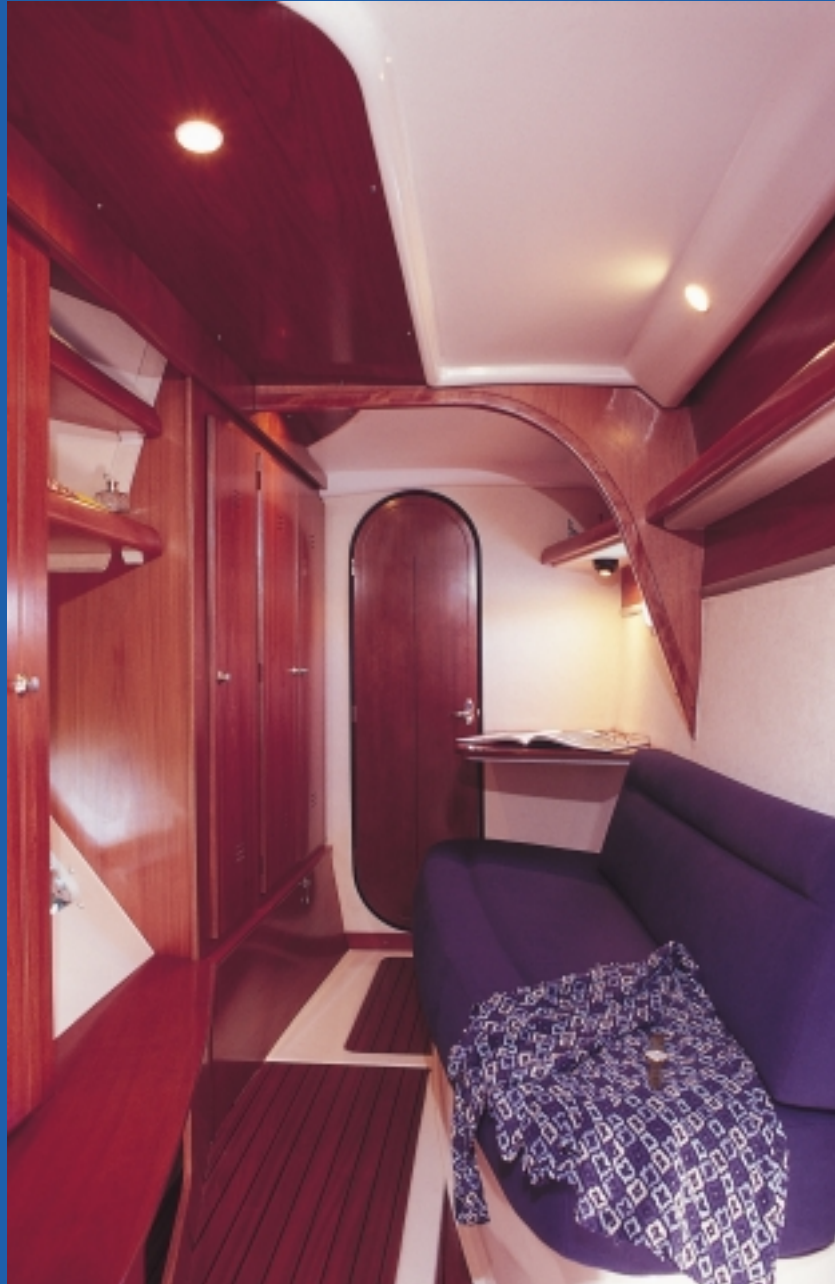
Suite propriétaire / Private owner suite