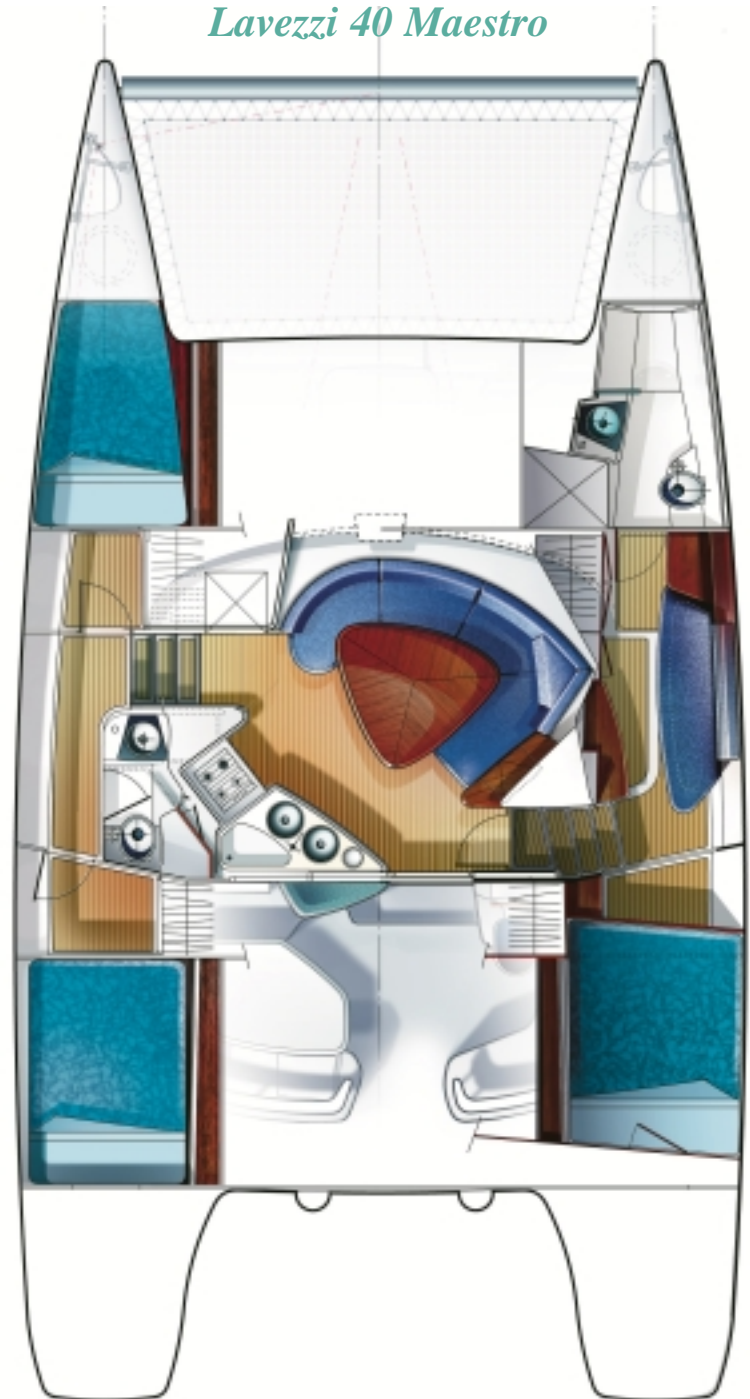
version propriétaire / Owner version