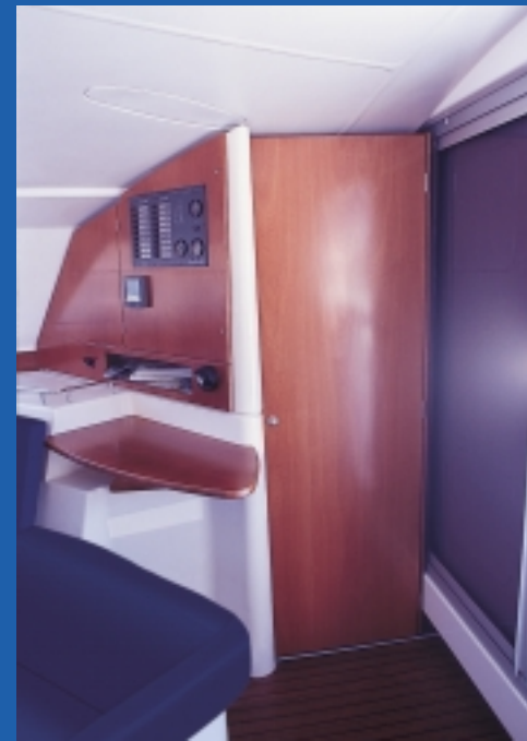
Door for private suite